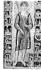
Costituzione 07 febbraio 1946