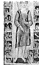
Costituzione 07 febbraio 1946