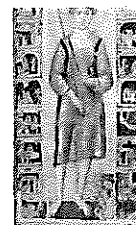
Costituzione 07 febbraio 1946